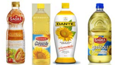
OLIO DI GIRASOLE